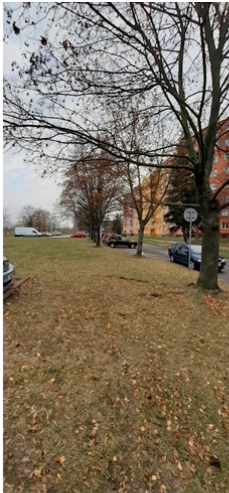
Obrázky 2 a 3: zásah do kořenové zóny dřevin stavbou plochy parkoviště