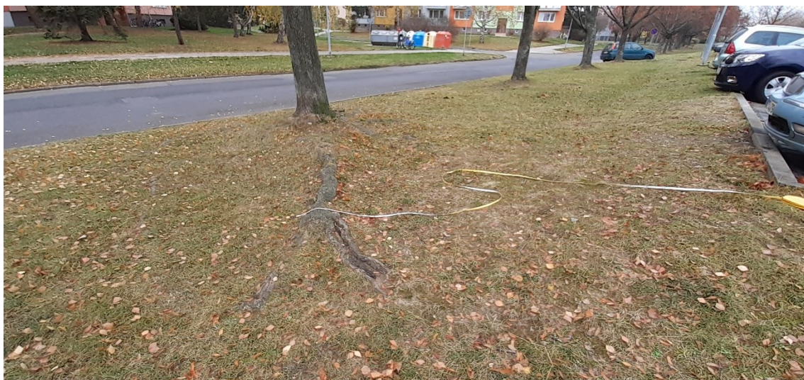
Obrázek č. 4: kořenový systém dřeviny č. 8 v blízkosti stavby parkoviště

Podle obecného popisu druhu javor mlč, je kořenový systém tohoto druhu srdčitý, středně hluboko až mělce kořenicí, kořeny dlouhé až do vzdálenosti 6 metrů (viz Javor mlč – Wikipedia.org; odborný článek „Posuzování žádostí o pokácení stromů“ Eva Mračanská, březen 2011)