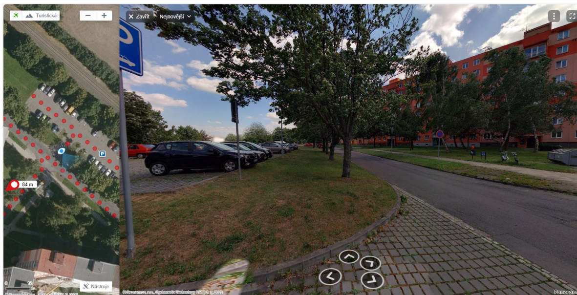
Obrázek č. 1 Pohled na dřeviny rostoucí na p.č. p.č. 2904/1 v k.ú. Opavské Předměstí

Vzhledem ke vzdálenosti záměru a charakteru stavby hrozí v rámci realizace negativní zásah do všech výše uvedených dřevin (minimálně poškozením nadzemních částí dřevin při pohybu těžké techniky a zhutňováním půdy těžkou technikou). Umístění záměru od paty kmene výše uvedených dřevin splňuje min. možnou vzdálenost (2,5 m dle normy Technologie vegetačních úprav v krajině – Ochrana stromů, porostů a vegetačních ploch při stavebních pracích). Vzhledem k plánovanému umístění záměru a velikosti koruny dřevin bude plocha nového parkoviště, přístupový chodník a nové vedené veřejného osvětlení, umístěno v kořenové zóně všech deseti výše uvedených dřevin (tj. plocha půdy pod korunou stromu rozšířená do stran o 1,5m viz norma ČSN 83 9061 kap. 4.6) viz obrázky 2 a 3. Vzhledem ke zjištěné vitalitě, zdravotnímu stavu a druhu, lze výše uvedené dřeviny zařadit do kategorie B (viz Standard SPPK 01002:2017 kap. 2.2). Vzhledem ke zjištěnému obvodu kmenů dřevin je chráněným kořenovým prostorem kruhová plocha o poloměru cca 2,4m až 3,5m (výpočet dle Standardu Agentury ochrany přírody a krajiny SPPK 01002:2017 kap. 3.1). Záměr bude veden v chráněném kořenovém prostoru dřevin č. 2 až 8.